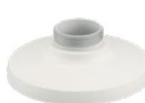
SBP-187HMW / SBP-187HM